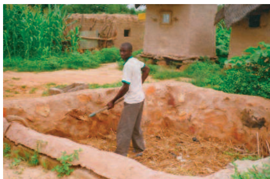
La construction de fosses fumières communes : une première étape indispensable

C'est pourquoi Sarepta, partenaire chrétien local du SEL, initie les bénéficiaires de son projet à la fabrication de fumure organique à partir de