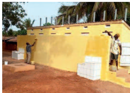
1 bloc de toilettes équivaut à 6 cabines dont 3 pour les hommes et 3 pour les femmes.

sibilise la communauté à l'hygiène et l'assainissement et met en place un comité de gestion, composé de