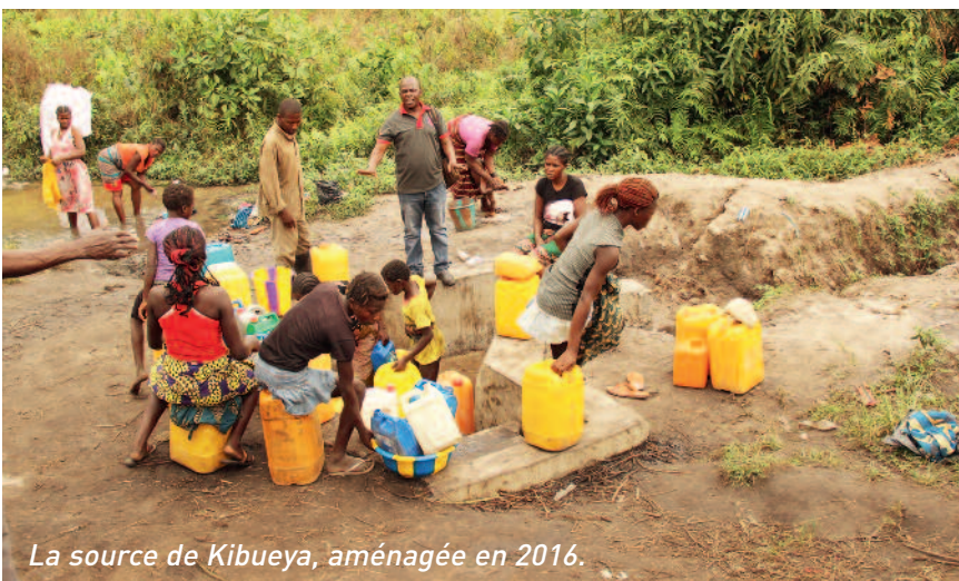
La source de Kibueya, aménagée en 2016.

Retrouvez les défis PAFI en vidéo sur la chaîne YouTube du SEL.